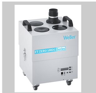
Fume extraction devices